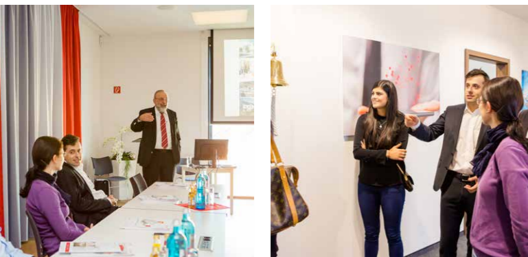
Impressionen vom TEAM3 + Club Treffen